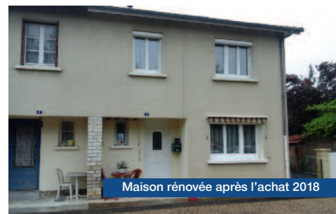
Maison rénovée après l'achat 2018

Elle ne regrette rien, bien au contraire : elle n'a plus rien à craindre ! Ce petit « château » est bien à elle, rien qu'à elle et pour toujours !