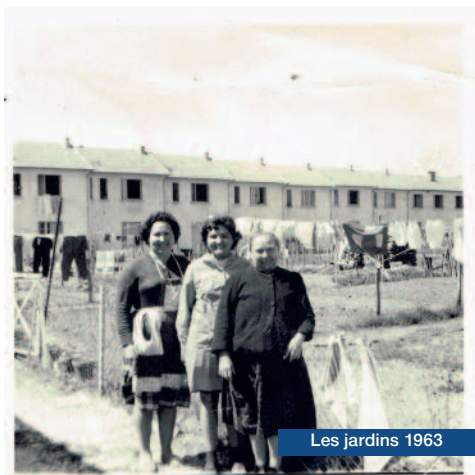
Les jardins 1963

Les maisons de la résidence Brossolette, rue Saint-Exupéry à Terrasson ont été construites en 1959. Elles étaient la deuxième réalisation de Dordogne Habitat. Elles disposaient du confort du moment même si le chauffage était assuré